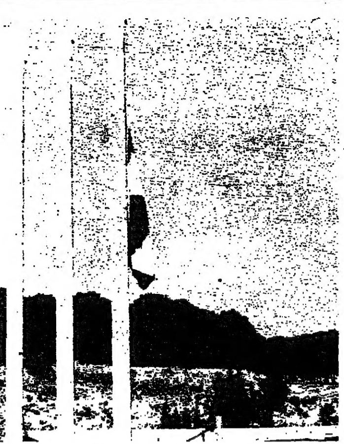
المعلم اللبناني متكسا حدادا على المرحوم مكاريوس

كان امس الاثنين يوم حداد رسمي في لبنان على الرئيس القديس الراحل المرحوم مكاريوس ، وقد تكتمت الاعلام على الجانب الرسمي والفتى الكنسية ، بل اجتمعت برامها الفخارية والاعمال منها بموسيقى كلاسيكية . ومعروف ان المرحوم مكاريوس شيخ امس الى مواء الاخير بحضور عدد من رؤساء الدول والزعماء العالميين . وقد مثل لبنان في المناسم وقد رسمي برئاسة الوزير الدكتور صلاح سلعان .